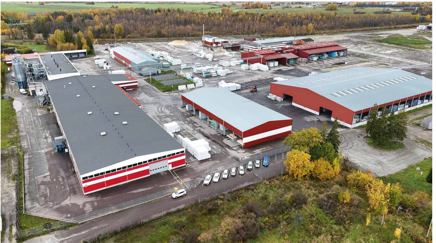
나피 공장 - 연간 최대 75,000m 3 의 가공목재제품 생산량