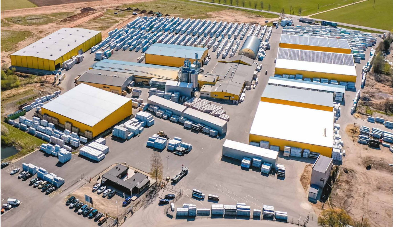
카르크시 공장 - 연간 최대 150,000m 3 의 가공목재제품 생산량

푸이두코다에는 연간 225,000m 3 의 가공목재제품 생산 능력을 갖춘 두 개의 공장이 있습니다.